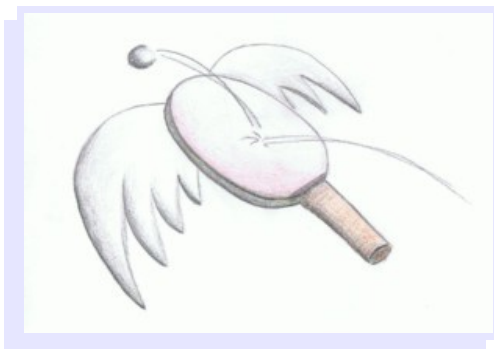
Logo der Aktion „Jeder Punkt Hilft“

Darüber hinaus hat die Oberligamann-schaft des Vereins in der Saison 2010/11 die Aktion "Jeder Punkt Hilft" ins Leben gerufen. Die knapp 15 Partner der Aktion haben sich zur Ent-richtung einer Spende für jeden erspiel-ten Punkt des Teams verpflichtet. 70% der Spende kommen der Nachwuchsar-beit im SV SCHOTT zugute, 30% werden an eine karitative Einrich-tung gespendet. Im Februar 2011 erhielt die Kinderhilfestiftung e.V. Jena als erster Begünstigter so die stattliche Summe von 444,60 €!