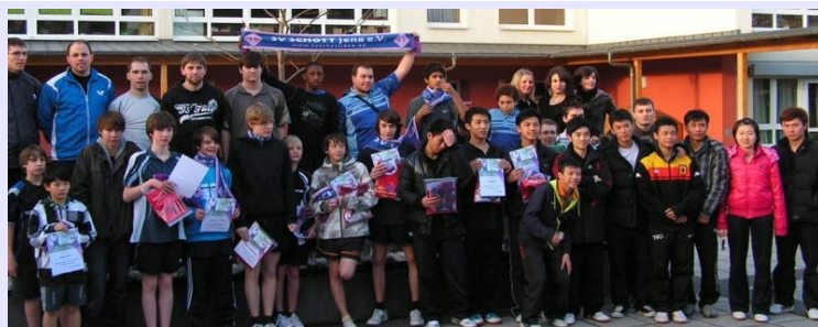
Gäste aus Aubervilliers (Frankreich) und Guangzhou (China) in Jena 2010

Deshalb nimmt die internationale Jugendarbeit in der Abteilung einen hohen Stellenwert ein. Seit 2008 wurden eine Reihe von Internationalen Sportjugendbegegnungen mit dem Club Municipal der Jenaer Partnerstadt Aubervilliers