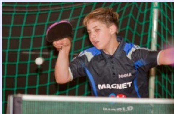
Der SCHOTT-Nachwuchs erfährt optimale Förderung

Die fachliche kompetente Ausbildung des Tischtennis-Nachwuchs nimmt im SV SCHOTT einen besonders hohen Stellenwert ein. Im täglichen Nachwuchstraining sorgt ein ganzes Dutzend lizenzierter Trainerinnen und Trainer dafür, dass Kinder und