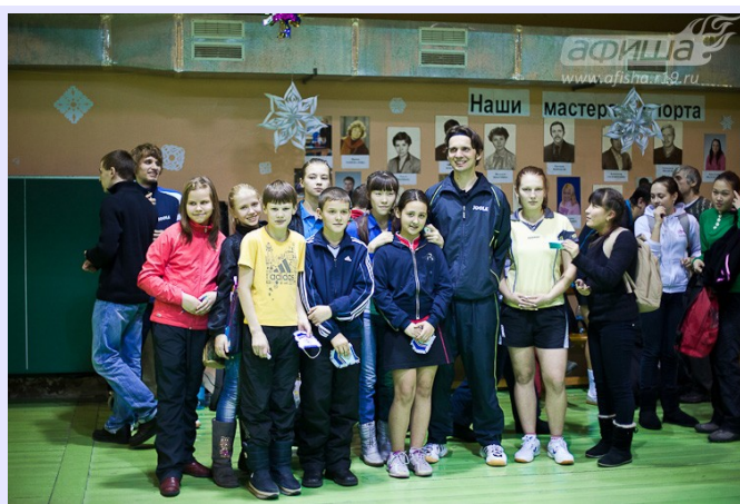
Sportler des SV SCHOTT zu Gast in Abakan in Sibirien

vor den Toren Paris erfolgreich durchgeführt. In 2010 konnte diese Partnerschaft um junge Sportler aus dem südchinesischen Guangzhou durch eine erste Begegnung in Jena erweitert werden. An Ostern 2011 reisen nun 20 Kinder und Jugendliche aus Jena und Aubervilliers ihrerseits nach Guangzhou und werden dort außergewöhnliche Erfahrungen sammeln dürfen, die sie sicher weit über die